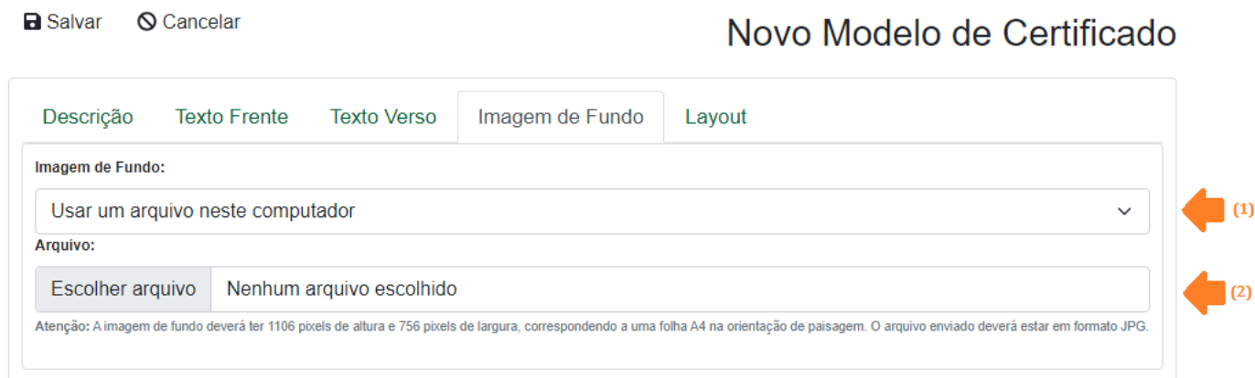
Figura 6 – Novo modelo de certificado – aba “Imagem de Fundo”

Posteriormente, envie a imagem de fundo do certificado, conforme a imagem a seguir.