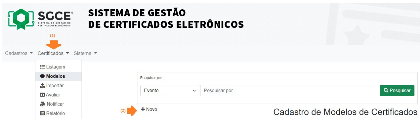
Figura 3 – Menu para cadastrar modelo de certificado no SGCE

Acesse o menu “Certificados > Modelo” e logo após clique no botão “+Novo”, conforme figura abaixo.