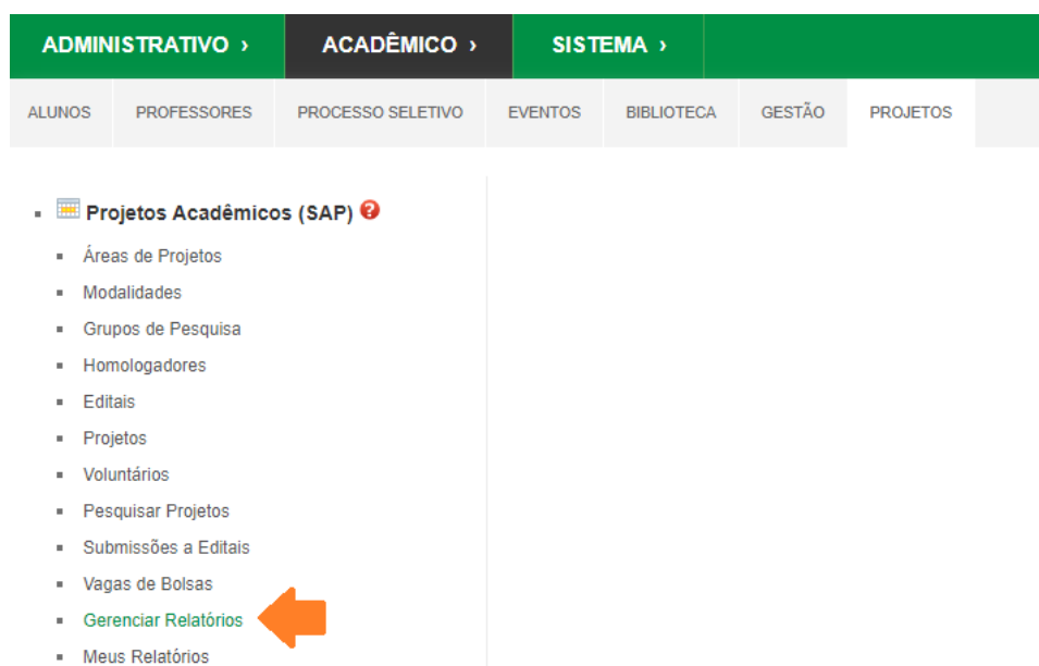
Figura 7 – Acesso ao item “Gerenciar Relatórios” do SAP

Com o modelo de certificado cadastrado, é possível gerar os certificados para os relatórios de projetos já validados. Para isso, acesse o menu “Gerenciar Relatórios” do módulo SAP do GURI, conforme imagem abaixo.