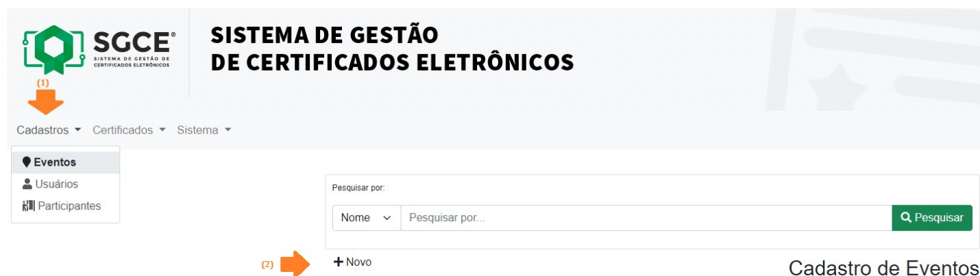
Figura 1 – Menu para cadastrar evento no SGCE

Realize o cadastro do projeto como um evento no SGCE, acessando o menu Cadastros > Eventos . Logo após, clique no botão “+Novo”, conforme figura abaixo.