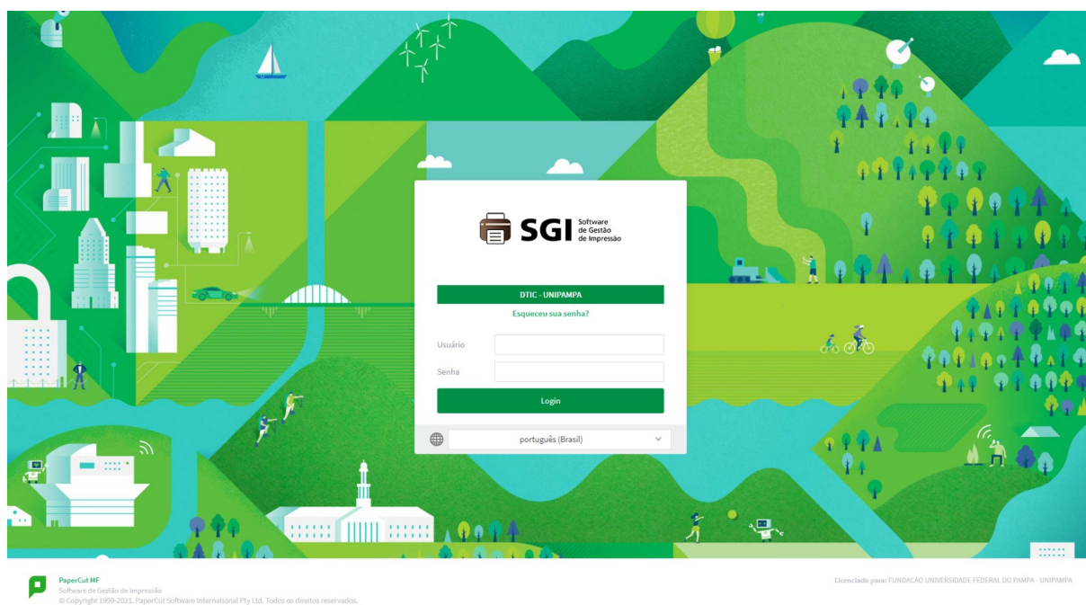
Figura 1: Impressão Web: SGI Login

1 Acesse o(s) endereço(s) https://sgi.unipampa.edu.br/ ou https://impressoras.unipampa.edu.br e faça a autenticação com o seu usuário institucional.